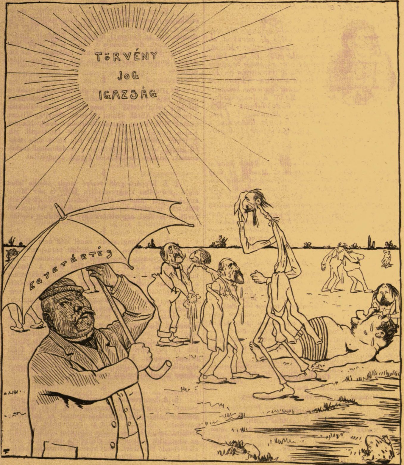
Eö-s K-ly. — Fiaim, csak sütkéreztek!