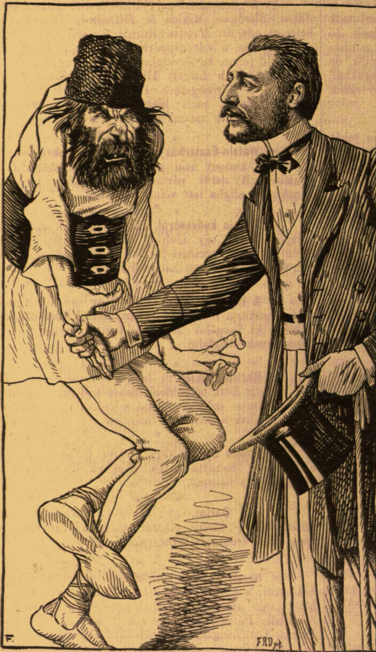
Oláh-magyar barátkozás Aradon.