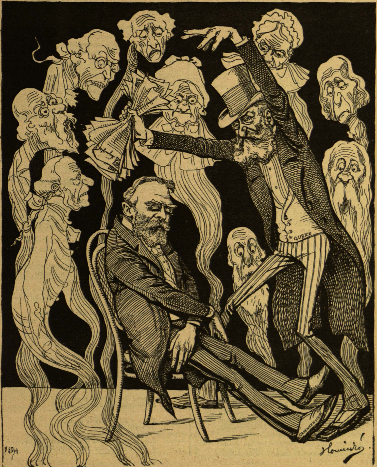
A meghalt lelkek hazajárnak a nyugdíjért.