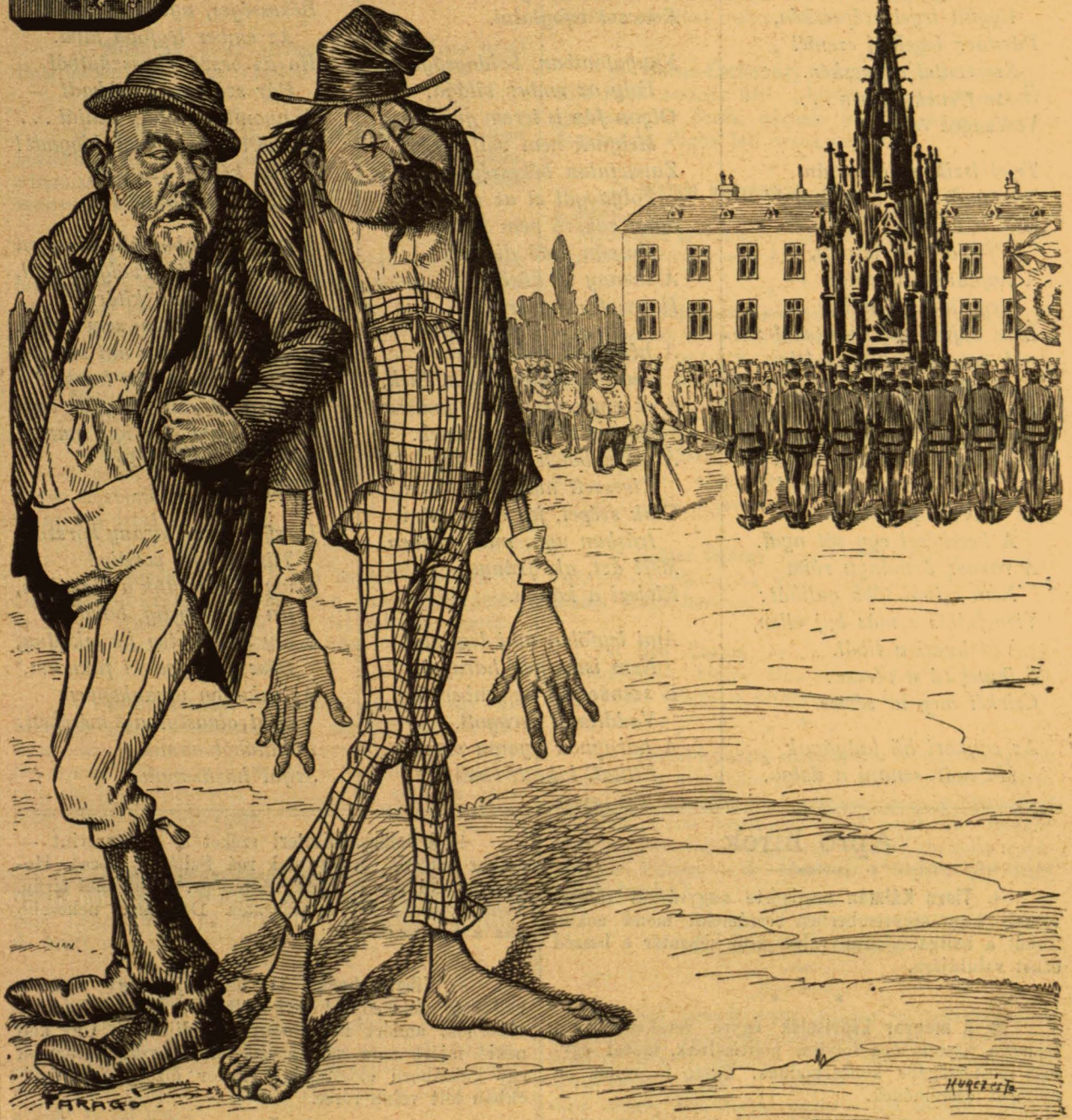
B — a Miklós dade. — No bibast, most már te ordít!

Előfizethetni a kiadó-hivatalban: Budapest, Kerepesi-ut 54. sz. Előfizetési díj: Egész évre 8 frt. — Félévre 4 frt. — Negyedévre 2 frt.